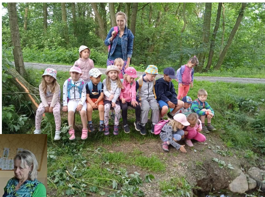
Výlet do Peršíkova.