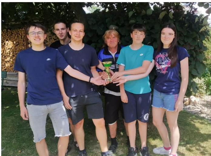
Část oudoleňského šachového týmu, který podruhé za sebou ovládl Regionální soutěž Vysočiny. Děkujeme vám za bravurní reprezentaci obce a přejeme, ať za rok dokonáte "hatrick"!

Vše označené cenou a značkou, včetně seznamu všech rozepsaných kusů s cenami.