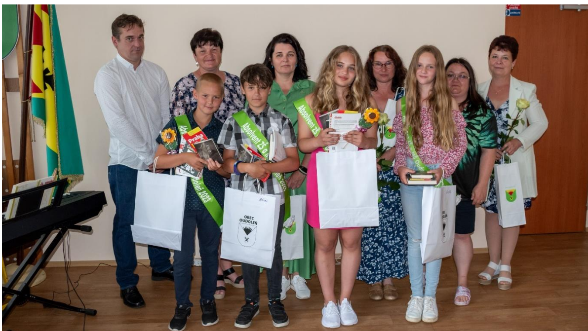
Loučení s páťáky.

ROČNÍK XVII. VYDÁNO: 12. 7. 2023. MĚSÍČNÍK ČÍSLO: 7. - 8. Uzávěrka příštího čísla: 21. 8. 2023. Evidenční číslo: MK ČR E 17544. Periodický tisk územního samosprávného celku. Vydává: Obec Oudoleň, Oudoleň 123, 582 24 Oudoleň, IČO: 00267996, DIČ: CZ00267996. Tel.: 569 642 201, 773 744 815, obec@oudolen.cz, www.oudolen.cz . Právo na tiskové chyby vyhrazeno.