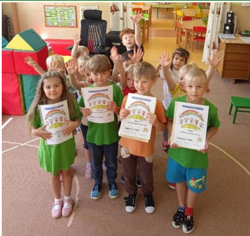
Loučení s předškoláky ve školce.

Jak jsou na tom se svojí vytrvalostí zjistily jednak při Pálácké stezce, kdy podle mapy, šipek a fáborků hledaly v přírodě stanoviště,