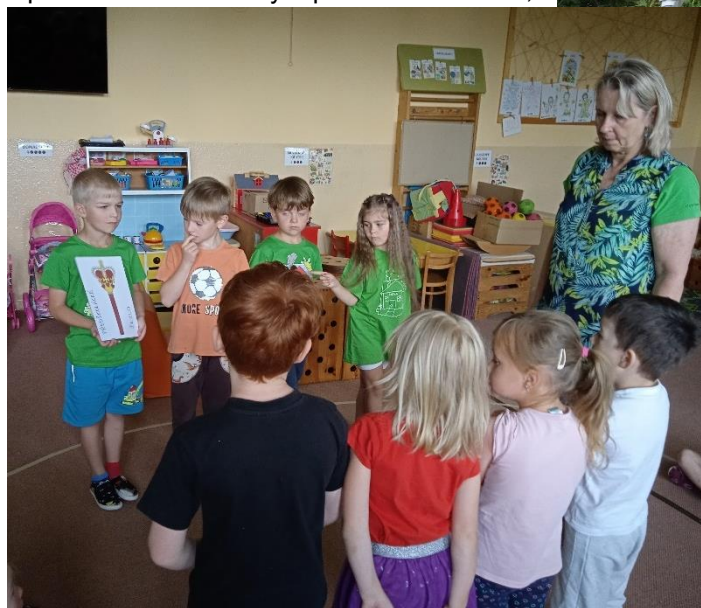
Předávání předškoláckého žezla.

na kterých plnily různé úkoly, a také při našem posledním výletě, kdy jsme se vydali brzkým linkovým autobusem do oblíbeného Peršíkova, kde nás naši školcoví peršíkovští kamarádi přivítali chlebem a solí, postupně provedli jejich vesničkou a pohostili ve svých domovech.